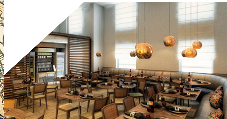
BEST WESTERN / DUQUE DE CAXIAS RJ