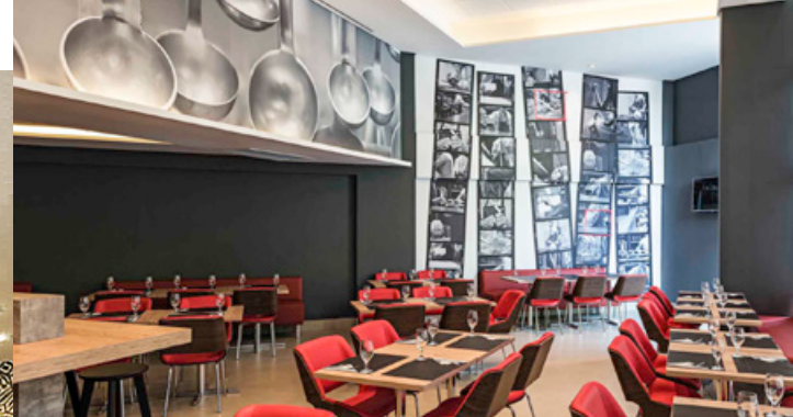
IBIS VALONGO \ SANTOS SP