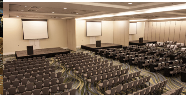
SOFITEL JEQUITIMAR \ GUARUJÁ SP