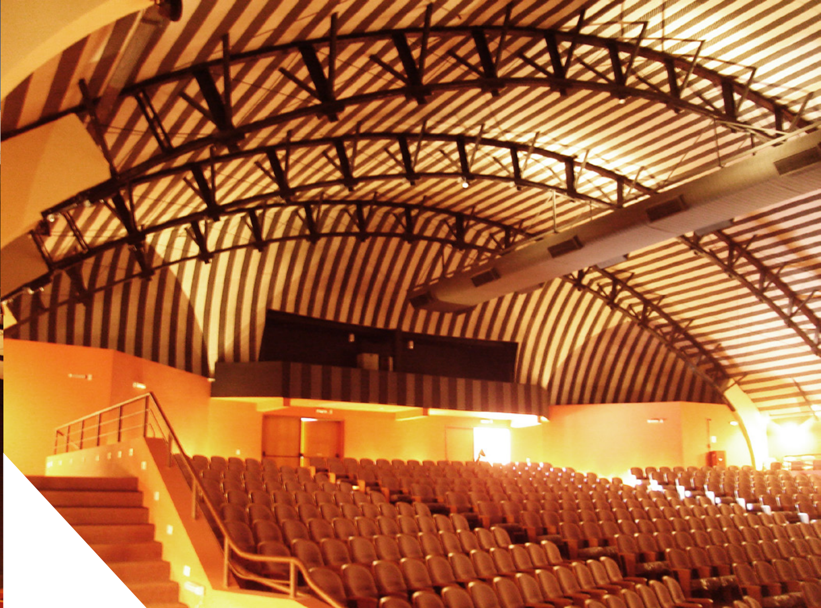
TEATRO UNILEVER VINHEDO

RESTAURO E RETROFIT \ 8.620M 2 / VINHEDO SP